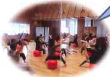
産前・産後の女性の心と体 の健康増進と仲間づくり