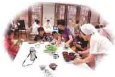
配食ボランティア団体と多世代 交流サロン事業を開催

平成14年8月 法人設立 平成15年～ 舞鶴市西市民プラザ管理運営を受託 平成21年～ 舞鶴市親と子のひろば事業を受託 平成23年 第5回京都市子育て支援表彰「地域貢献部門」