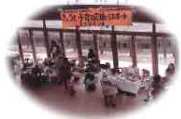
子育て応援パスポートミニイベ ント等、府の子育て支援事業を実施