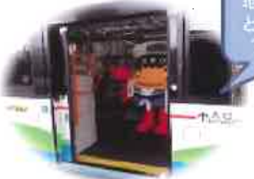
企業・他団体とのつながりづくり・ 合同企画イベントの開催