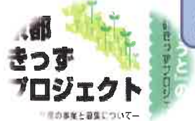
京都の子育て支援者・団体と のネットワークによる取組み