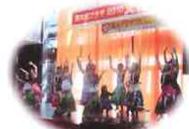
市民活動団体・サークルの発 表や展示の場・機会を提供