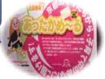
携帯メールによる子育て情報 配信事業の北部地域を担当