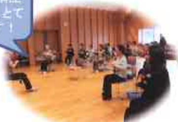
インストラクターグループとの協 働で介護予防体操教室を開催