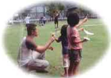
父親による父親の育児参加を 応援するイベントを開催