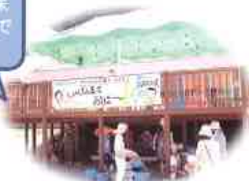
地域子育て支援拠点事業で のアウトリーチ