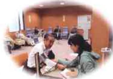
【健康サロン】での保健師に よる健康相談