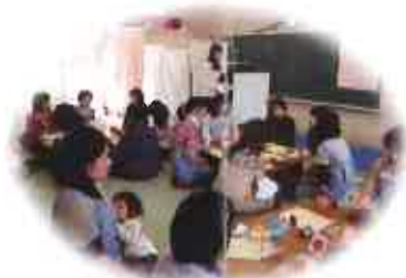
先輩ママスタッフを中心に した子育て座談会・講座