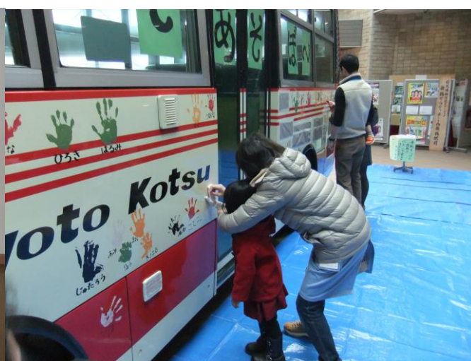
バスに手形をつけよう