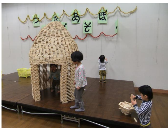
つみきであそぼう