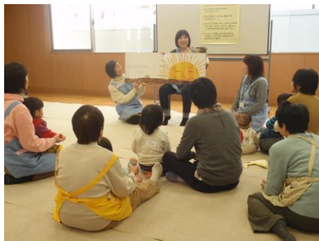
カンガルーママ広場