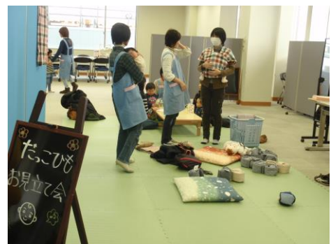
だっこひもお見立て会