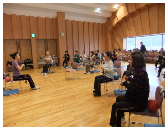
ワンコイン講座健康体操 すわろビクス