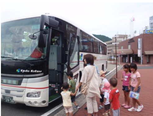
バスで学び舎@石井食品